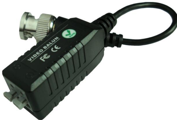
Рис.1 Внешний вид TP-C/5