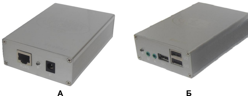
Рис.1 Внешний вид TA-U1/4 (А)+RA-U3/4(Б)