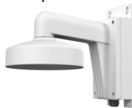
DS-1273ZJ-135B Настенный кронштейн с монтажной коробкой