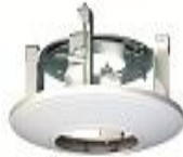
DS-1227ZJ Внутрипотолочное крепление