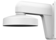
DS-1273ZJ-135 Настенный кронштейн