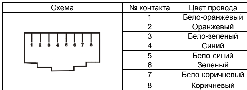
Таб.3 Распиновка разъема RJ45 для передачи видео, аудио и данных.