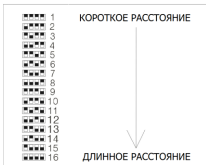
Рис.5 Комбинации DIP-переключателей на приёмнике RA-CA2