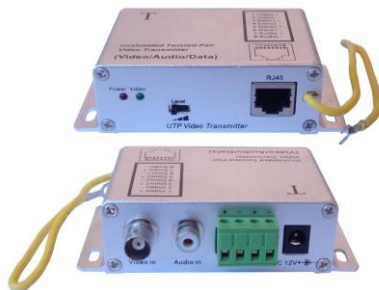
Рис.1 Внешний вид TA-CA2