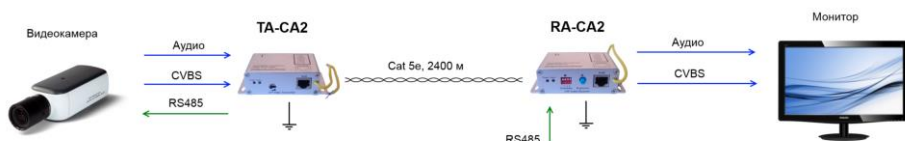
Рис.3 Активная передача видео, аудио и данных.