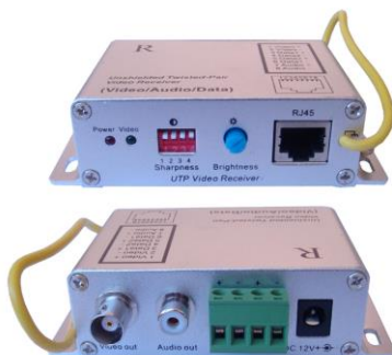
Рис.2 Внешний вид RA-CA2