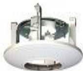
DS-1227ZJ Внутрипотолочное крепление