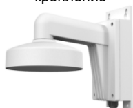
DS-1273ZJ-135B Настенный кронштейн с монтажной коробкой