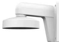
DS-1273ZJ-135 Настенный кронштейн