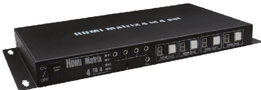
Рис. 1 Коммутатор MX-Hi404, вид спереди.