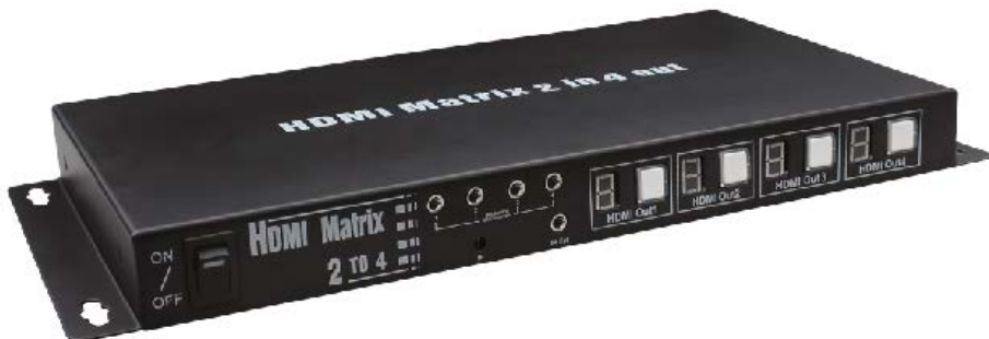
Рис. 1 Коммутатор MX-Hi204, вид спереди.