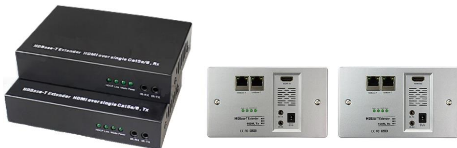
Рис. 1 TA-Hi/BT+RA-Hi/BT комплект передатчик + приёмник, его настенное исполнение TA-Hi/BT(W)+RA-Hi/BT(W)