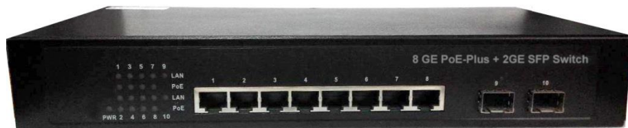
Рис.1 Коммутатор SW-8082/B