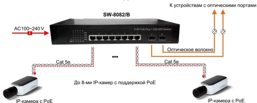
Рис. 3 Схема подключения коммутатора SW-8082/B