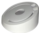
DS-1259ZJ Потолочное крепление