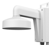
DS-1272ZJ-110B Настенный кронштейн