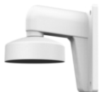
DS-1272ZJ-110 Настенный кронштейн