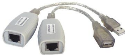
Рис.1 Внешний вид TA-U1/1+RA-U1/1